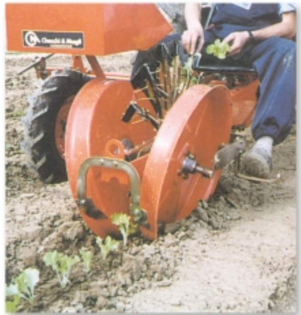
FOXDRIVE R14 DT/3

Row markers, watering device, 300-litre tank, extra seat, tray holder for containers of rootballed seedling, adjustable clod separator, adjustable ploughshare, microgranulator and fertilizer broadcaster.